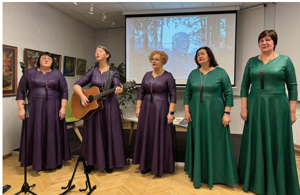
Knygos pristatymo metu pasirodė Kiemėnų moterų vokalinis ansamblis „Sarbenta“.