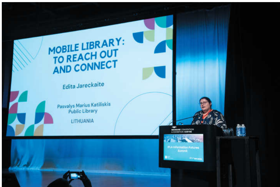
Editos dėka apie Pasvalį ir Lietuvą sužinojo kolegos iš viso pasaulio. Konferencijoje ji skaitė pranešimą apie naujas mobiliosios bibliotekos veiklas.