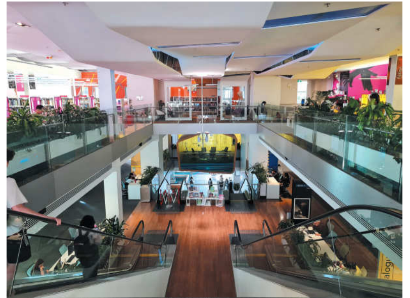
Brisbane biblioteka gali pasigirti ir eskalatoriais.

ten, kur tą dieną norisi. Bibliotekos pritaikytos ne tik knygoms skaityti, kai kuriose galima surasti visą informaciją apie savivaldybės teikiamas paslaugas ir netgi viešojo transporto tvarkaraščius.