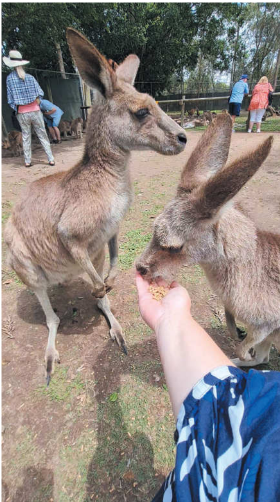
Rezervate gyvenančios kengūros įpratusios prie žmonių dėmesio.

Pastarosios labai drąsios ir specialų maistą valgo tiesiai iš delno. Jų akys gražiomis, riestomis blakstienomis, man jos priminė mūsiškes stirmas. Koalos mažytės, mielos, pūkuotos, bet labai išrankios maistui. Minta tik eukaliptų lapais, pačiomis jų viršūnėlėmis. Ir jeigu šiandien