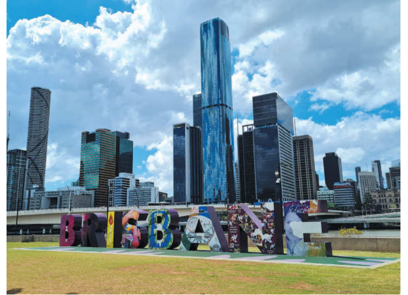
Brisbane – daugiausiai dangoraižių visoje Australijoje turintis miestas. Po aštuonerių metų čia vyks olimpinės žaidynės.

– Sužavėjo didžiulis, erdvus Brisbane miesto bibliotekos pastatas stiklinėmis sienomis, lankytojų patogumui kaip prekybos centruose įrengti eskalatoriai. Daug atvirų erdvių – be jokių langų ar durų, atviros laiptinės, lipi laiptais ir jauti vėjo dvelksmą... Mums, šiaurės kraštų gyventojams tai visiškai egzotika. Australijos klimatas leidžia mėgautis šiltu oru visus metus. Būdamas bibliotekoje gali jaustis tarsi išėjęs į gamtą, prisėdęs terasoje su knyga rankose, klausytis paukščių čiulbėjimo ir mėgautis supančia natūralia žaluma. Dauguma baldų ant ratukų, lankytojai gali juos pasistatyti