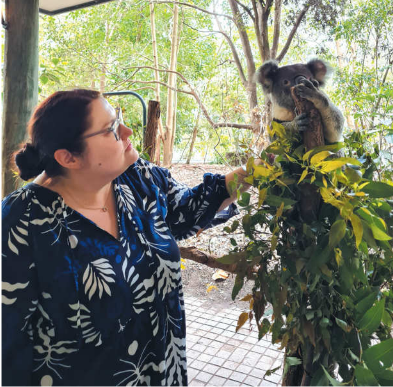
Jaukūs „pūkuotukai“ – koalos.

– Esu biržietė, Pasvalio bibliotekoje su projektais dirbu dar tik trečius metus, tačiau šis darbas labai mane įtraukė. Bibliotekininkystė dažnam iš mūsų tapusi ne tik darbu, bet ir gyvenimo būdu. Norisi susipažinti ir bendrauti su kolegomis iš kitų Lietuvos ir užsienio bibliotekų, dalintis patirtimis. Domiuosi galimybėmis dalyvauti tarptautinėse konferencijose. Sugrįžusi iš tokių susitikimų galiu drąsiai teigti, jog užsienio ir mūsų šalies bibliotekininkų bendruomenių veiklos yra labai