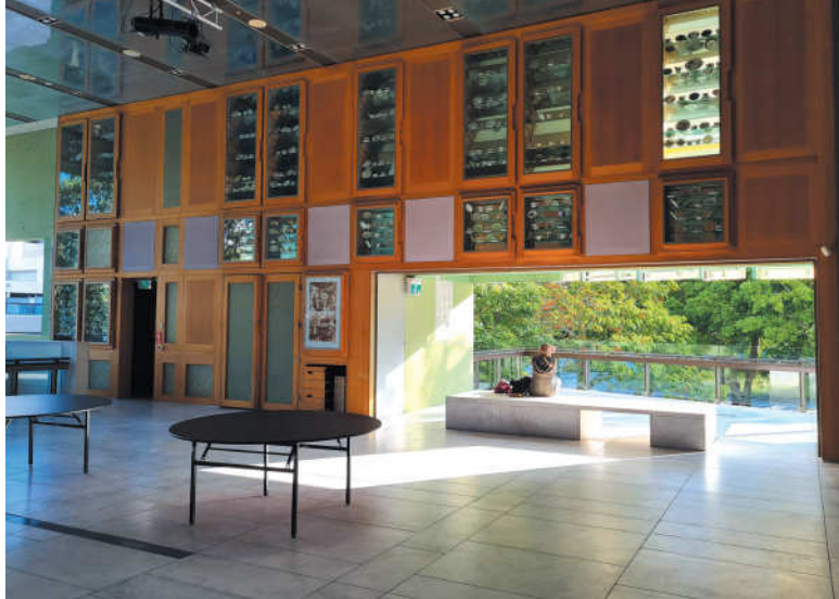
Patalpų erdvės su atviromis terasomis.

– Didelis dėmesys skiriamas paveldui išsaugoti ar atgaivinti, čiabuvių gentims. Jos turi savo bendruomenes, stengiasi išlaikyti tradicijas ir papročius. Renginiai pradedami jų tradiciniais pasirodymais. Į mūsų konferenciją pakviesta čiabuvių genties atstovė, palaiminusi visus susirinkusiuosius, tarsi