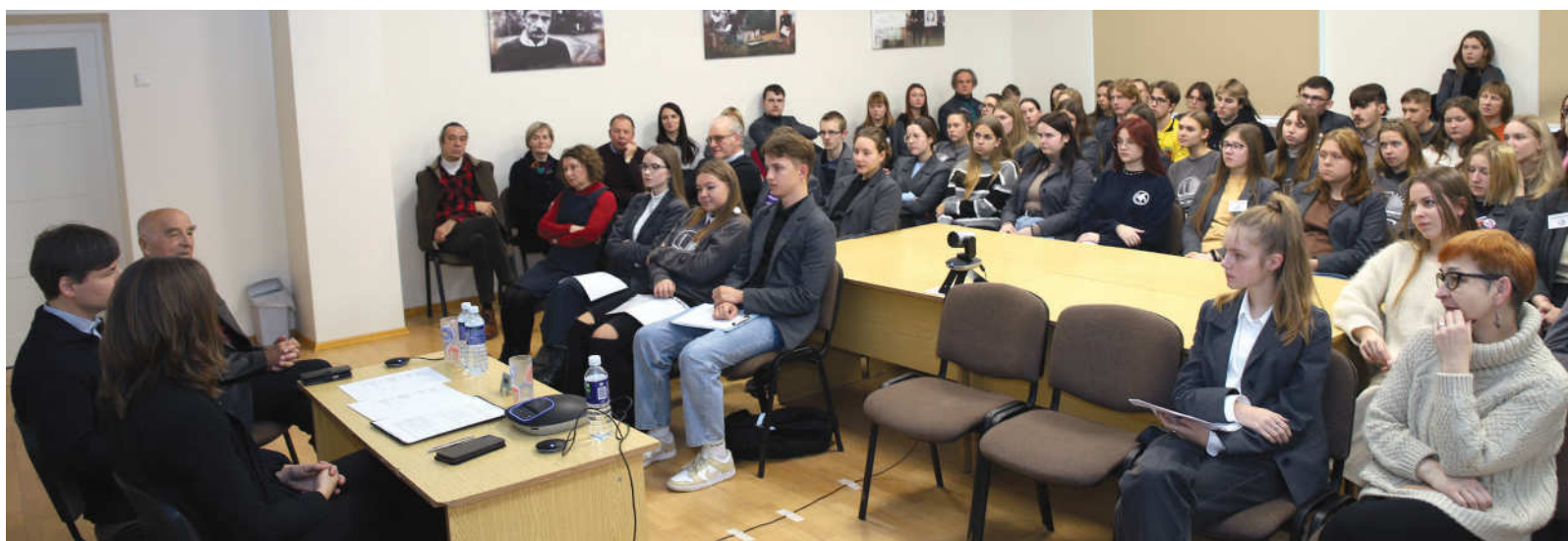
Pasvalio gimnazijai filosofija pamažu tampa vis artimesnė.