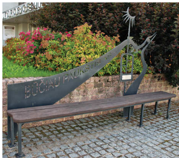
1. Atminimo suoliukas režisieriui Gintarui Kutkauskui prie Pasvalio kultūros centro.