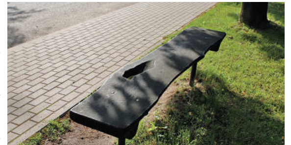
4. Suolelis su skylute prie senųjų kapinių Avižonio gatvėje.