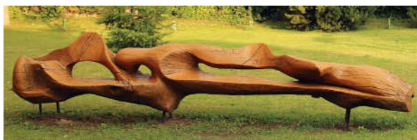
6. Arūno Grušo kurtas suolas Pasvalio gimnazijos kieme.