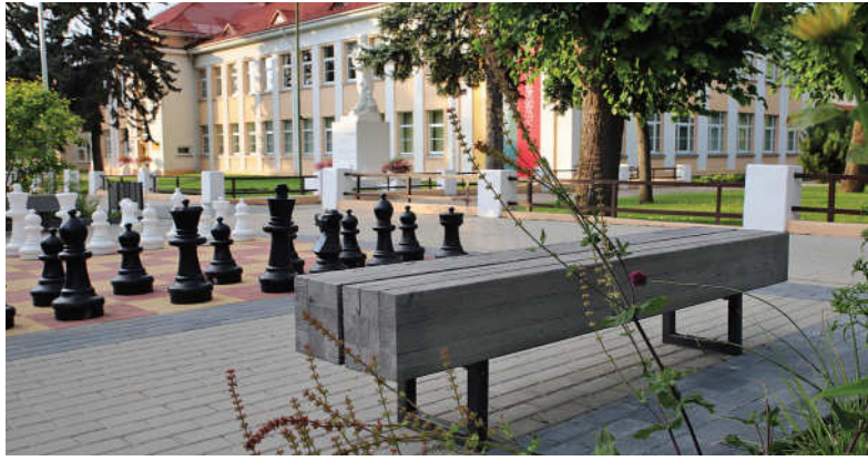
8. Suoliukai skverelyje tarp Petro Vileišio gimnazijos ir „Riešuto“ mokyklos.

suolelį! Ant poeto liežuvio dažnas mėgsta prisėsti. Gal tai įkvepia ir patiems ką nors parašyti?