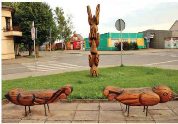
5. Suoliukai-paukščiukai skverelyje tarp Avižonio ir Panevėžio gatvių.

4. Suolelis su skylute prie senųjų kapinių Avižonio gatvėje. Tai ramioje miesto vietoje stovintis vienišas, poetiškas suoliukas. Rodos, niekuo neišsiskiriantis, bet visgi išskirtinis.