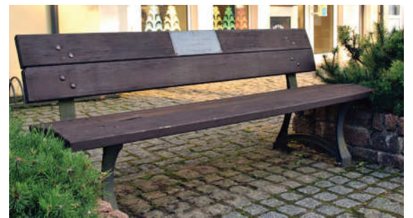
2. Skaitymo suolelis prie Mariaus Katiliškio viešosios bibliotekos.

9. Kompozicija skverelyje prie „PayPost“ kiosko, Gėlių gatvėje. Na, pagal paskirtį ši skulptūra turbūt – ne suolelis. Bet kūrybiškai prisėsti čia tikrai vilioja. Liepsnos motyvais šį kelių dalių kūrinių 2008 metais padirbino inicialais S. G. pasirašęs autorius. Ant nuožulnius suolelius primenančių ugnies liežuvių ypač gera stabtelėti pavasarį, kai ryškiai rožine spalva pražysta