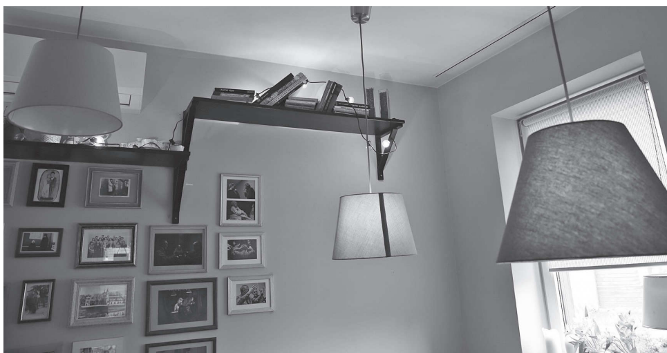
3. Knygų mainykla „Sagoje“.