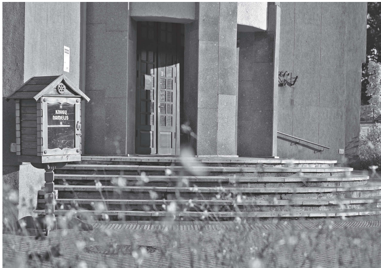
2. Namelis prie Pasvalio seniūnijos.