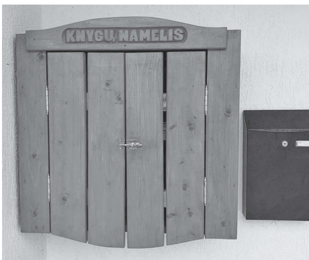
Durelės į knygų namelį Joniškėlyje.

Gabijos STANISLOVAITYTĖS žemėlapis