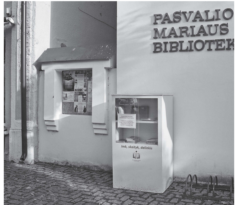
1. Mariaus Katiliškio viešosios bibliotekos knygų namelis.