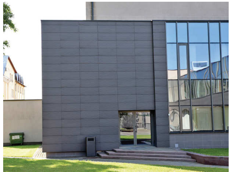
Kultūros centro fasadas jau nebeprimena sovietinių laikų „kultūrniamio“.

aukšte bei oranžerija. Pastarosios erdvės ypač laukia netradicines susitikimų vietas mėgstantys lankytojai.