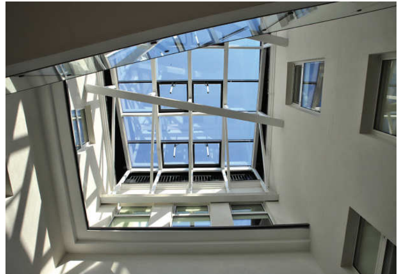
Bibliotekos oranžerija bus viena jausiausių netradicinių susitikimų vieta.