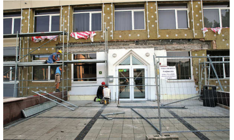
Savivaldybės administracinis pastatas jau baigiamas apšiltinti.