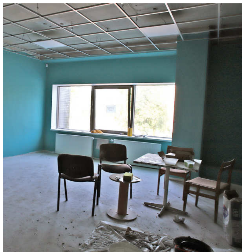
Nebaigtos modernizuoti erdvės kultūros centro viduje.