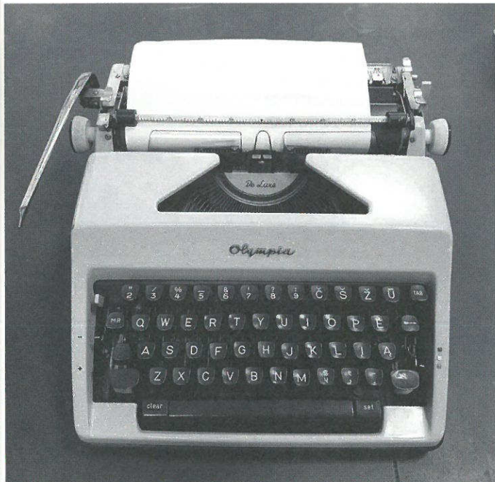
Mariaus Katiliškio rašomoji mašinėlė „Olympia“.