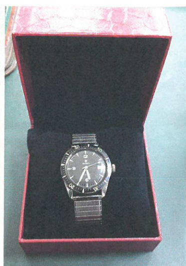
Mariaus Katiliškio rankinis laikrodis „Stellaris“.