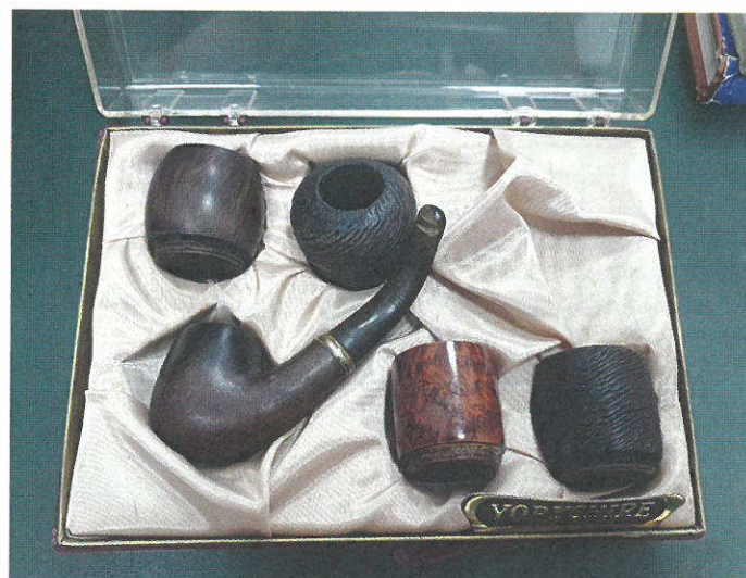
Pypkė su keičiamais antgaliais originalioje dėžutėje